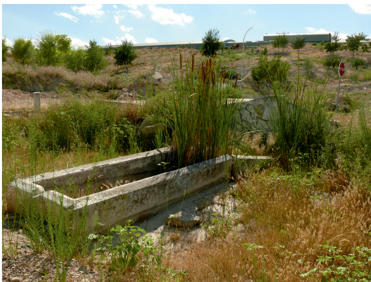
Fotografía 1: Fuente de la Minga (Autor: Antonio Pérez Fernández)

No olvidemos que muchas de estas fuentes han desaparecido, para nuestra desgracia, como la Fuente del Tirajo, y e incluso otras están desapareciendo poco a poco, como la Mina de los Frailes recientemente redescubierta (y que el Grupo de Espeleología de Villacarrillo va a publicar un extenso trabajo en el boletín de los Amigos de la Historia de Villacarrillo del presente 2012) o la Fuente de la Minga, que como se ve en