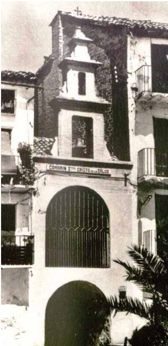
El Camarín en los años 60

En 1943 se encargan varias lámparas para las fiestas, reemplazando a las desaparecidas en la guerra. Dos años más tarde se reparan la armadura y los cristales rotos del Camarín, y se restauran las imágenes del Cristo y de Ntra. Sra. de los Dolores, deterioradas en la contienda. En el año 1949 una gran sequía ocasiona un aumento desmesurado del paro. Ante esta angustiada situación la Junta Directiva reduce los festejos a los cultos religiosos, suprimiendo la verbena y la petición de donativos, a los que tan generosamente