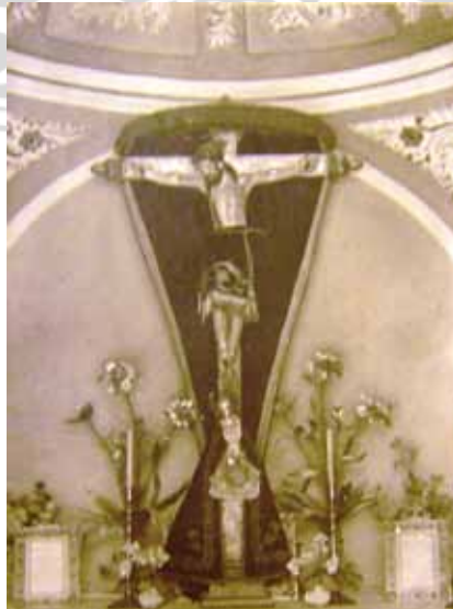
Cristo de la Salud y Dolorosa. Años 20