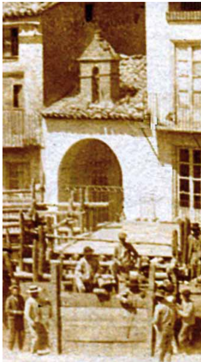
El Camarín a finales del s. XIX

Durante la Guerra Civil la Cofradía se extingue, pero una vez concluida ésta, el 15 de agosto de 1939, se reorganiza en una reunión