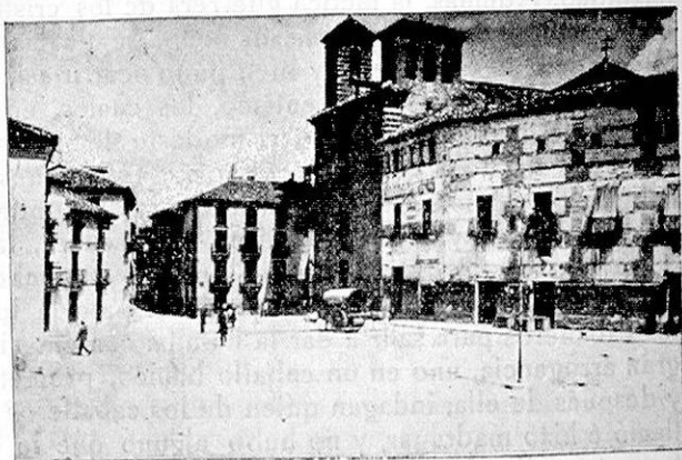
Típica plaza nueva de Cazorla, Capital del Adelantamiento

Las villas de caçorla y las demas de su adelantamiento que son Eli-ruela Iznatorafe Villa carrillo Villanueva del arçobispo y soriguela y que- sada que un tiempo fue del adelantamiento y otros castillos que estan en su termino ganó de los moros Don Rodrigo Ximenez de Rada Arzo- bispo de Toledo, año de 1231 en tiempo del Rey don fernando el Sancto como lo refiere el mismo Arçobispo en su historia lib. 9 cap. 15. Y el sancto Rey donó las dichas villas al dicho Arçobispo y á su yglesia de toledo por lo cual le sirvió en otras conquistas y porque la de caçorla la hizo á su costa. Desde este tiempo los Arçobispos se tuvieron por seño- res de las dichas villas que despues este estado se llamó Adelantamien- to y lo defendieron de los moros y en su defensa murió el Arçobispo Don Sancho Infante de Aragon en la vega de quessada; despues acordaron de hacer esta defensa por vn capitán á quien dieron titulo de Adelantado de caçorla y de capitán general de la sancta yglesia de Toledo y le dieron la jurisdicción y le adjudicaron para sustento suyo las penas de camara los diezmos que pertenecian al prelado y el onçavo de unas tierras que son y se llaman de su mesa arçobispal. El primer capitán que sin titulo de Ade-